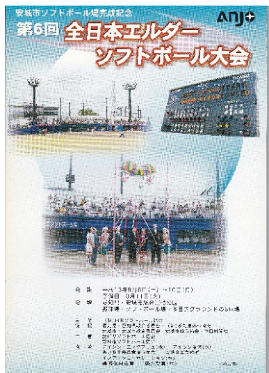
全日本エルダー大会のプログラム表紙