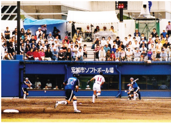
日本女子リーグ安城大会