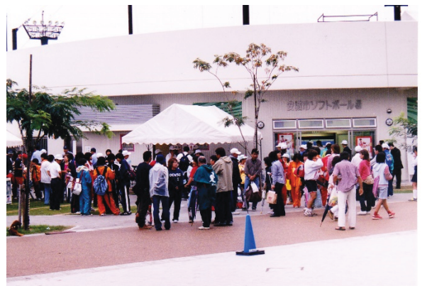
日本女子リーグ安城大会 (安城市ソフトボール場A球場)