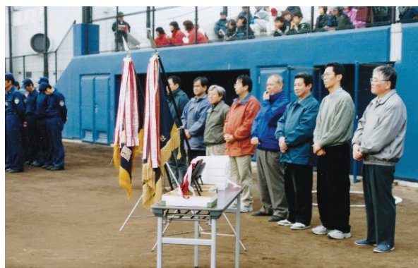
安城市小学生大会後援中日新聞販売店の皆さん