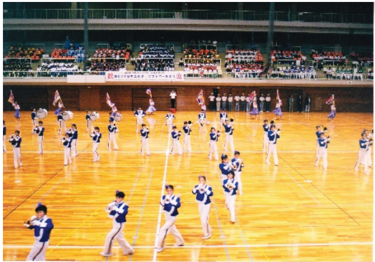
全日本エルダー大会開会式アトラクション (安城市体育館)