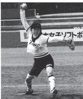
好投した金原だったが……。大鵬は、まだ両目が開かない。

守っては、先発・清水が8安打を打たれながら1失点で完投。粘り強いピッチングでチームの勝利に貢献した。戸田はこれで11勝7敗。ミキハウスと並んで同率5位となり、決勝トーナメント進出へ望みをつないだ。