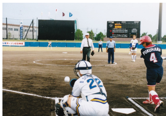
安城市ソフトボール場A球場 始球式