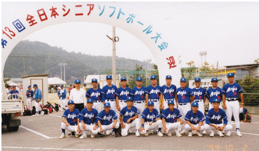
全日本シニア大会(広島県福山市)出場 安城シニアクラブ