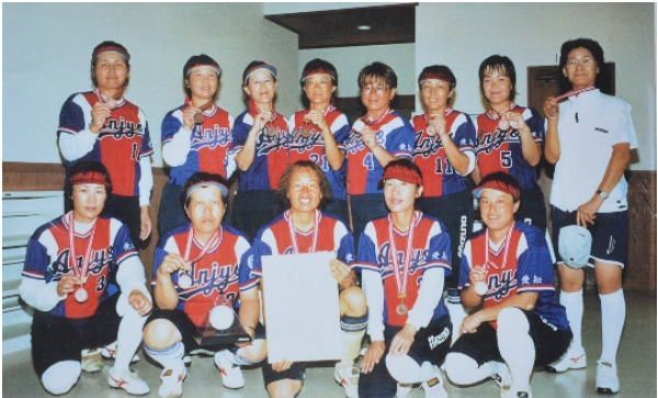
全日本エルダー大会（福井県敦賀市）第3位 安城クラブ