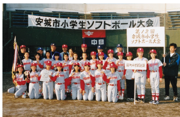
安城市小学生大会 (優勝 桜町小学校選抜)