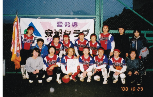
東海地域総合大会（静岡県掛川市）優勝 安城クラブ