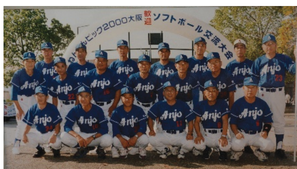
ねんりんピック大阪大会出場 安城シニアクラブ