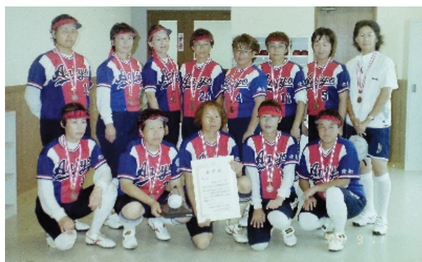
全日本エルダー大会 (福井県敦賀市) 第3位 安城女子クラブ