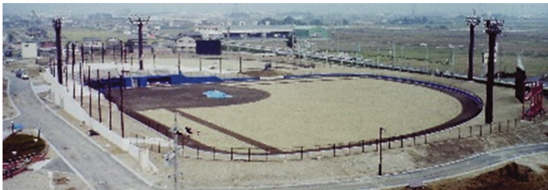
工事が進むソフトボール場A球場（11月）