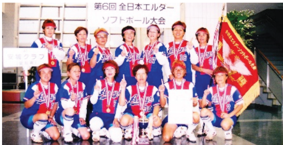
全日本エルダー大会 (安城市開催) 優勝 安城クラブ