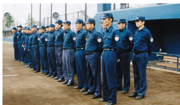
安城市小学生大会 審判員