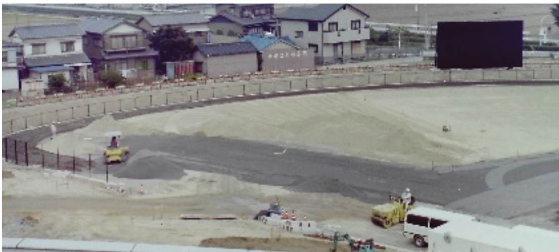
工事が進むソフトボール場B球場