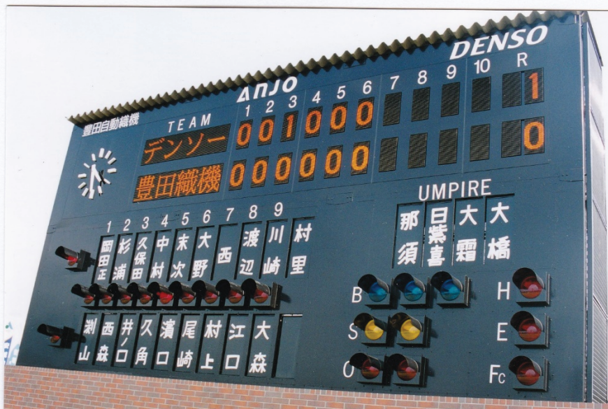
2001年 安城市ソフトボール場A球場 竣工式