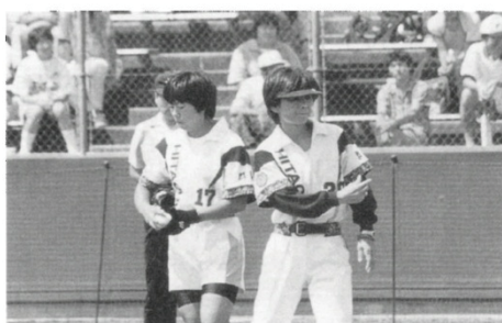
▲伊藤(仮) (写真左)の好投で12勝目を挙げた高崎

日立高崎 1-0 ミキハウス 高崎・伊藤(仮)がキレの良い変化球を駆使して好投すれば、ミキは柳生、ハーディングの継投で対抗。息詰まる投手戦となり、0-0のまま延長タイブレークにもつれ込んだ。 高崎は9回、タイブレークの走者を犠打で進め、7番・伊藤(仮)が右前にタイムリー。待望の先取点を挙げた。 一方、ミキは高崎・伊藤(仮)を最後まで崩せず、完封負けを喫した。