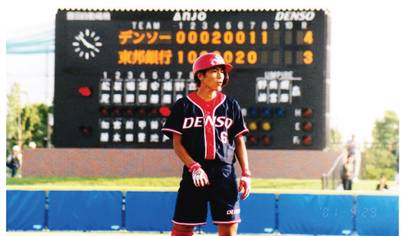
日本女子リーグ安城大会